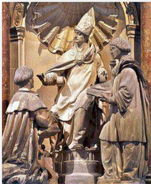
Là où Je suis, là aussi sera mon serviteur (Jn 12, 26)

Elles concernent toutes les familles, les papas, les mamans, les bébés, les enfants, les jeunes, les personnes âgées seules, les grands-parents : vous êtes TOUS les bienvenus, même si vous êtes seul avec votre enfant.