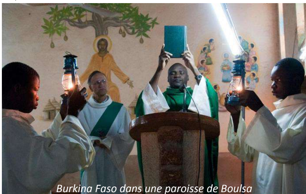
Burkina Faso dans une paroisse de Boulsa

comme Jésus à ses frères et sœurs orthodoxes. Accueil, prière, liturgie du frère rythment ma vie au quotidien en partageant le dîner avec des fiancés, en bénissant des maisons, en visitant des aînés, en priant en binôme pour toute demande d'intercession lors des veillées de la miséricorde, en participant à la liturgie dominicale avec l'assemblée des fidèles, en marchant avec des paroissiens sur les pas de Sainte Germaine de Pibrac... Une mission à la rencontre des communautés chrétiennes d'Afrique avec ses chants joyeux et ses danses pour son Seigneur, des Eglises d'Europe, d'Asie et d'Amérique, des cultures et des religions dans des échanges et partages avec des mollahs, des moines bouddhistes, des pasteurs d'Allemagne. Les Journées Mondiales de la Jeunesse, les rencontres européennes de Taizé, le jumelage avec le Mali ont été des temps forts inoubliables de joies partagées, de louange, d'actions de grâce.